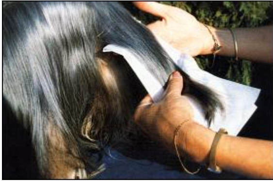
Das Wickelpapier richtig falten...