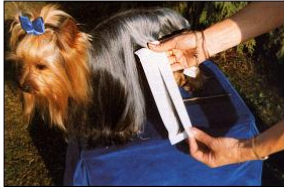
...und die Haarsträhne einlegen.