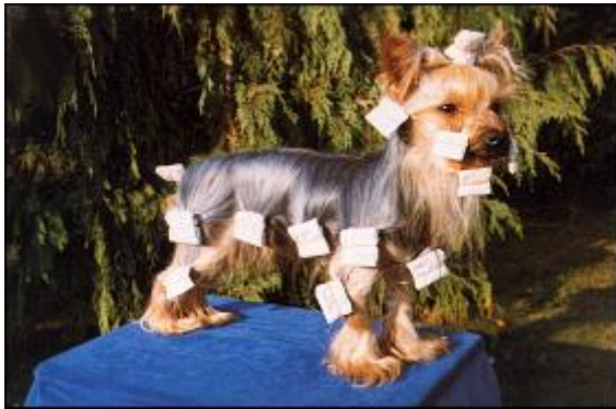
So »verpackt« ist das Haar geschützt und Ihr Yorkie kann auch im Garten spielen.

Verwenden Sie nicht zuviel Wickelöl! Sind die Wickel locker geworden, muss man sie zwischendurch öffnen und neu »einlegen«. Spätestens nach etwa einer Woche sollte man den Yorkie baden, frisch einölen und mit neuem Wickelpapier wickeln.